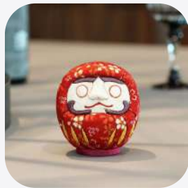
だるま 江戸木目込み人形 埼玉県