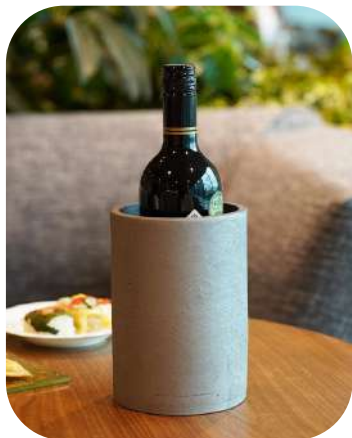
【ワインクーラー】 青海波 | 三州瓦

ボトルキーパーの模様「青海波（せいがいは）」限りなく広がる穏やかな波のように見えることから、「未来永劫と平和な暮らしへの願い」という意味が込められています。