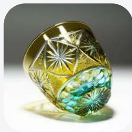
冷酒グラス 切子 東京都