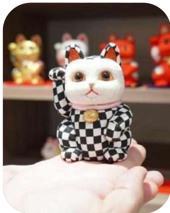
【招き猫】 市松柄 | 江戸木目込み