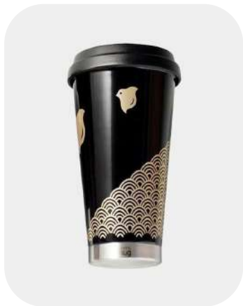
【モバイルタンブラー】 波千鳥 (ブラック) | 越前漆器