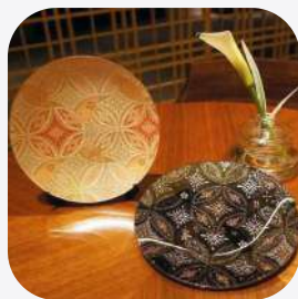
ORI-ZARA (華七宝) 西陣織の皿 京都府