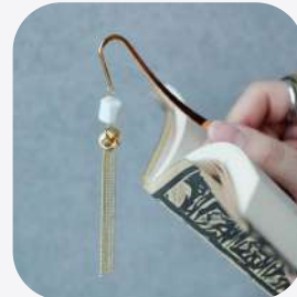
ブックマーカー 有田焼 佐賀県