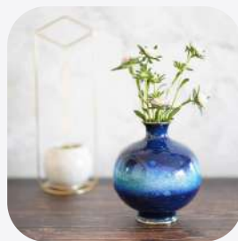
一輪挿し 尾張七宝 愛知県