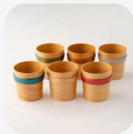
カップ 大館曲げわっぱ 秋田県