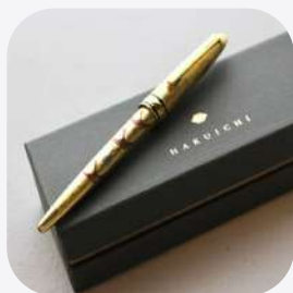
蒔絵ボールペン 金沢箔 石川県