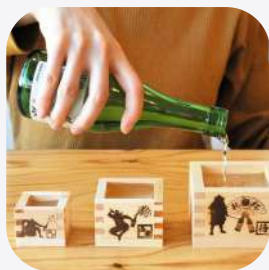
枺 JAPANESE to MASU 岐阜県