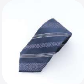
ネクタイ 博多織 福岡県