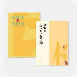
カタログギフト 工芸品&食べ物 メイドインジャパンだけを厳選